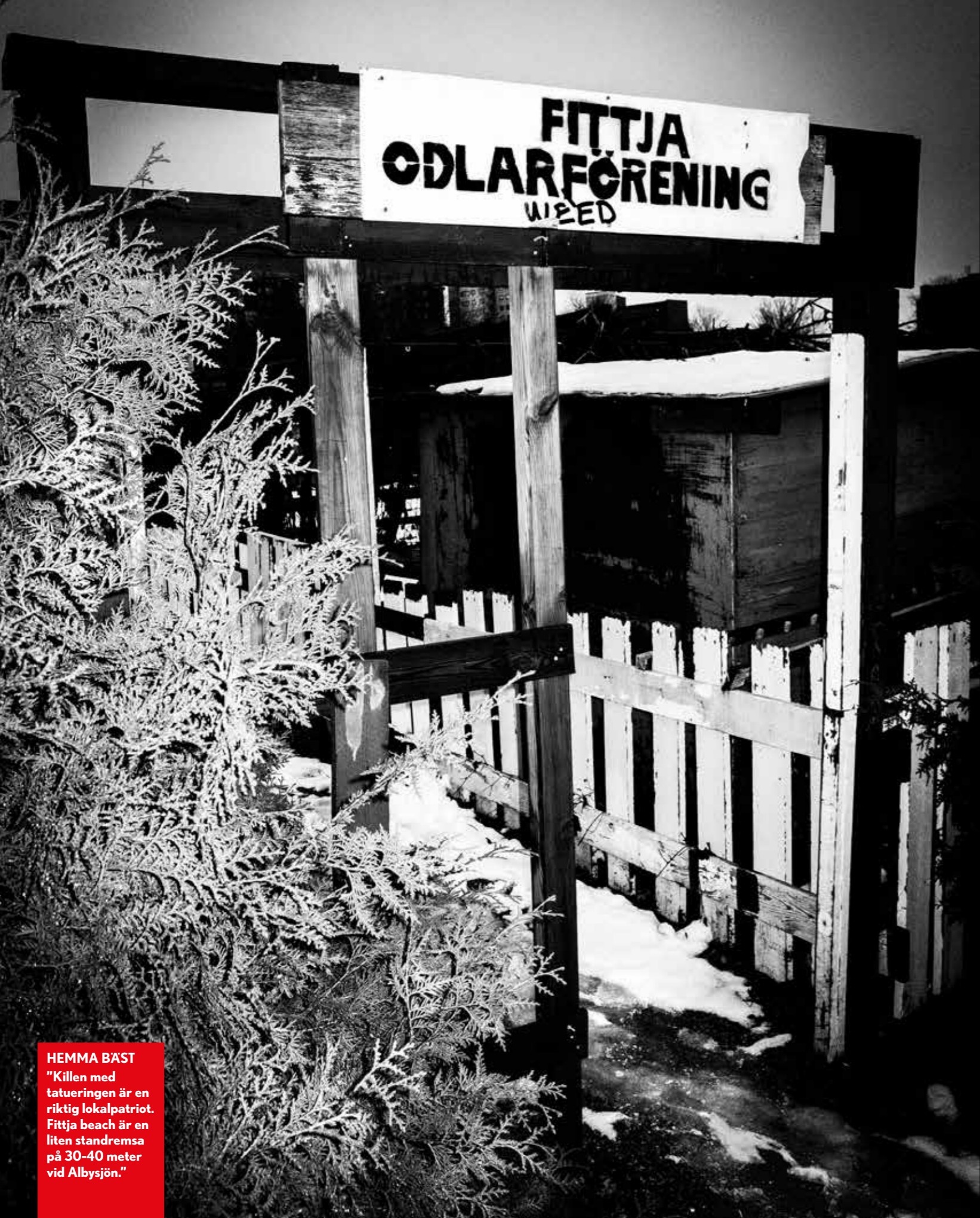
HEMMA BÄST "Killen med tatueringen är en riktig lokalpatriot. Fittja beach är en liten standremsa på 30-40 meter vid Albysjön."